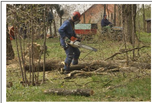
A lakossági bejelentések legnagyobb része fakivágással kapcsolatos.