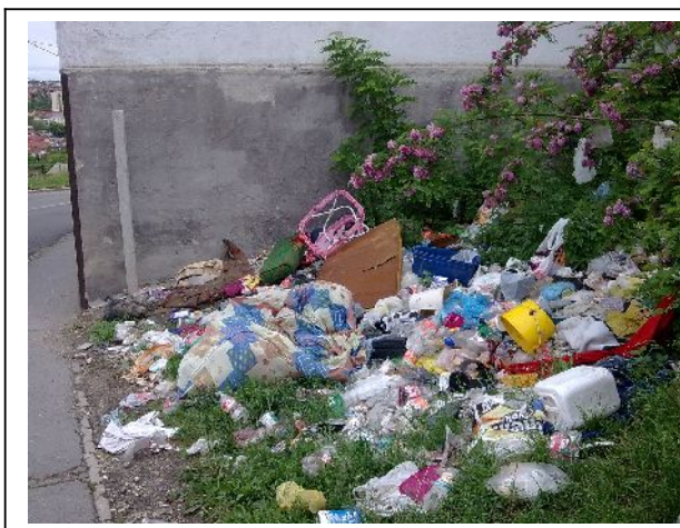
Az illegális hulladéklerakás az elkövetők felderítése, velük szemben eljárások indítása számos ügyünk témája.